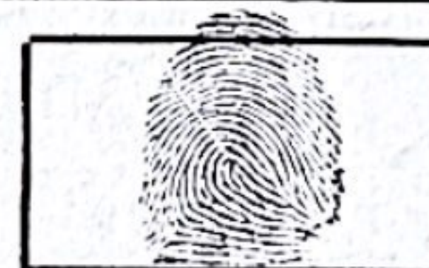
Huella Índice Derecho